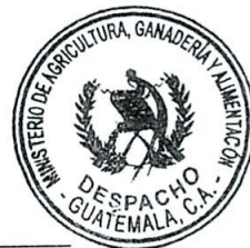
Ing. Maynor Estuardo Estrada Rosales MINISTRO DE AGRICULTURA, GANADERÍA Y ALIMENTACIÓN

ARTÍCULO 2. El presente Acuerdo Ministerial empieza a regir inmediatamente.